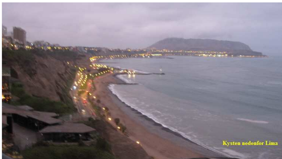
Kysten nedenfor Lima