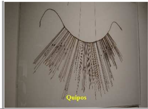
Den underlige 'halskæde', Quipos , på billedet har været anvendt til at registrere ting, der kan tælles. Snorenes farve, antal tråde betød noget for, hvad det var man talte, antallet af knuder og afstanden mellem dem, hvor meget. Faktisk udgjorde det et decimalsystem.

I tilknytning hertil har man lavet en separat afdeling med erotisk keramik. Der er intet nyt under solen, men det er en interessant lille samling.