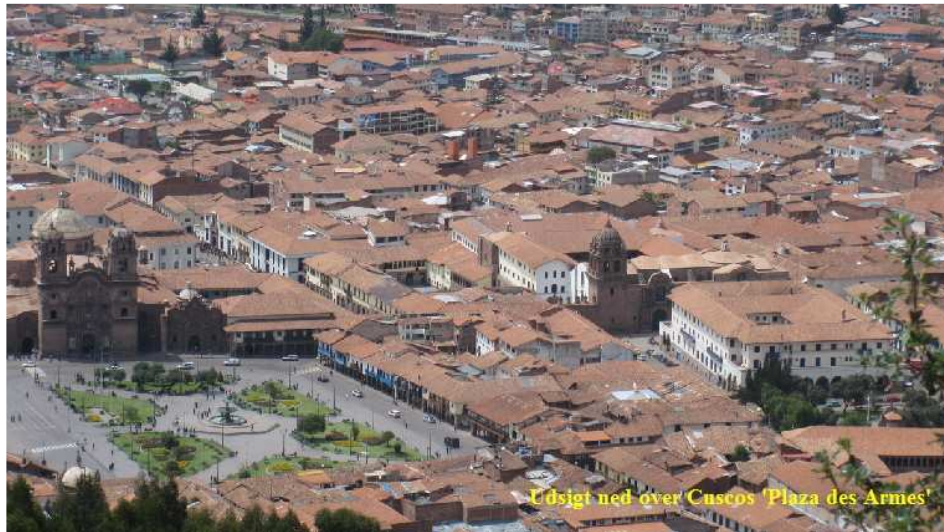
Udsigt ned over Cuscos 'Plaza des Armes'

Denne side er en del af vores store Sydamerikarejse .